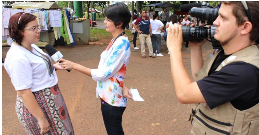
Entrevista com Psicóloga de Uberlândia/MG durante JB Na Praça