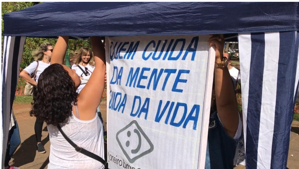
Caminhada das Emoções [Belo Horizonte | Set de 2017]