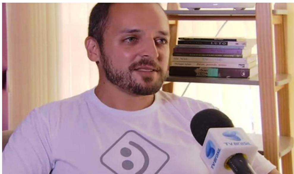
Psicólogo de Brasília concedendo entrevista sobre o JB à mídia

Todos os meios e veículos midiáticos do Brasil têm contribuído para o crescimento, a difusão e o fortalecimento da Campanha Janeiro Branco no país. Em todo o território nacional – e não somente no mês de Janeiro –, os cidadãos e profissionais da saúde ligados à campanha têm sido convidados para inúmeras entrevistas a respeito da importância, das características, dos objetivos e das estratégias do Janeiro Branco para a promoção de Saúde Emocional nas vidas das pessoas.