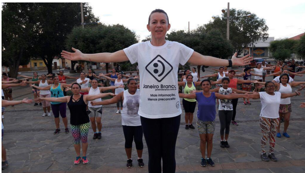
Campanha Janeiro Branco [Castelo do Piauí | Jan de 2017]