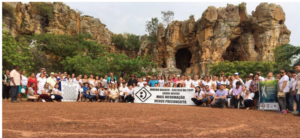
Campanha Janeiro Branco [Castelo do Piauí | Jan de 2017]